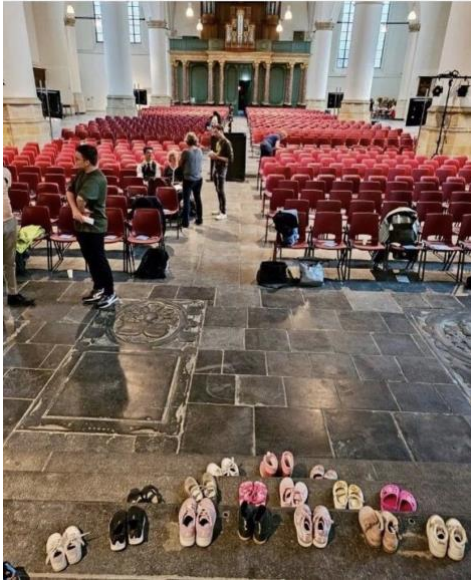
Toekomstige generaties staan klaar in de Grote Kerk, Prinsjesdag 2023

symfonieorkest, van volksdans tot hiphop en van TikTok tot museumkunst.