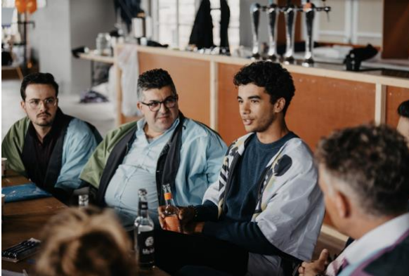
Plekberaad in Leiden, 2022