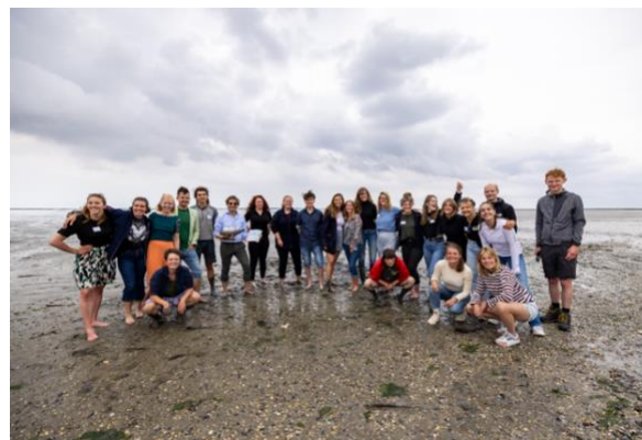
Waddemars ism Arcadia en Waddenacademie, 2022

Een ander voorbeeld zijn de bibliotheken die in toenemende mate platform willen bieden voor het ontwikkelen van burgerschapsvaardigheden en democratisch burgerschap. Plekberaden sluiten naadloos aan op deze missie. Vanaf 2024 werkt het MvdT dan ook aan pilots plekberaden in bibliotheken in verschillende regio's.