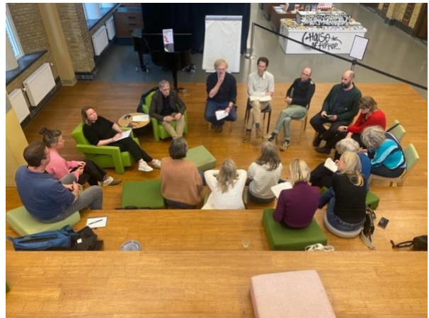
Democratiecirkel in het Huis van Actief Burgerschap, 31 januari 2024

Rondom thema's worden zelfsturende werkcirkels opgericht bestaande uit tijdrebelln met een expertise of interesse in het betreffende onderwerp. Veelal vinden de themaberaden plaats in samenwerking met bestaande landelijke consortia of netwerkorganisaties die al thematransities activeren. In 2024 werken de zelfsturende werkcirkels democratie en onderwijs toe naar een themaberaad.