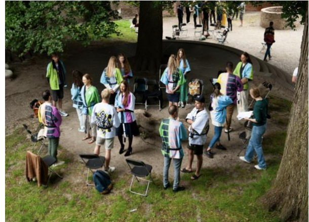
Plekberaad in Leiden, juni 2022

Er zijn drie soorten plekberaden. Een klein plekberaad (A) speelt zich af binnen een relatief overzichtelijke plek zoals een straat of organisatie . Een middelgroot plekberaad (B) heeft betrekking op een wijk of dorp . Een groot plekberaad (C) gaat om een stad, regio of provincie .