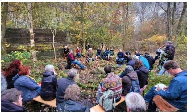
Roman Krznaric in gesprek met Ministers van de Toekomst in de eco-kathedraal in Heerenveen, 2021

In navolging van de Britse filosoof Roman Krznaric, auteur van het boek The Good Ancestor (2021) die de naam 'time rebel' heeft gemunt, noemen wij onszelf tijdrebellens. In onze zwerm vind je een bonte verzameling van verbeelders (kunstenaars, vormgevers en creatieven), begrijpers (wetenschappers, journalisten, onderzoekers en nieuwsgierige geesten) en doeners (projectleiders, producenten en handen-uit-de-mouwen-stekers).