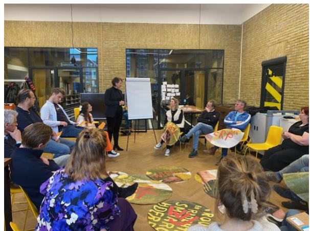
Onderwijscirkel in het Huis van Actief Burgerschap, 31 januari 2024