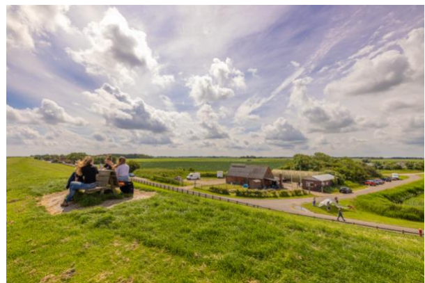
Waddenmars met jongeren uit het waddengebied, juni 2022