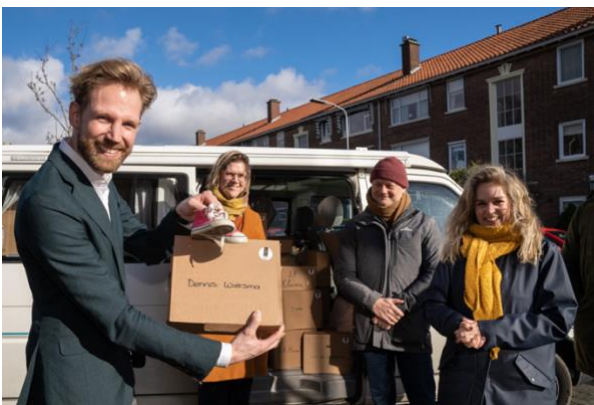
Minister van Onderwijs Dennis Wiersma neemt kinderschoentjes in ontvangst, februari 2022

We nodigen alle Ministers van de Toekomst uit om zelf interventies te bedenken en stellen daartoe jaarlijks zeven micro-budgetten beschikbaar voor kleine interventies. Ook worden jaarlijks twee grotere opdrachten gegeven aan professionele makers die zich verbinden met de gekozen jaarthema's.