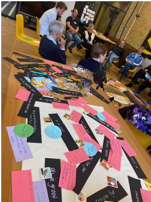
Onderwijscirkel in het Huis van Actief Burgerschap, 31 januari 2024