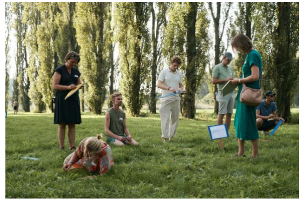
Ritueel in de Groene Kathedraal Almere, september 2023.